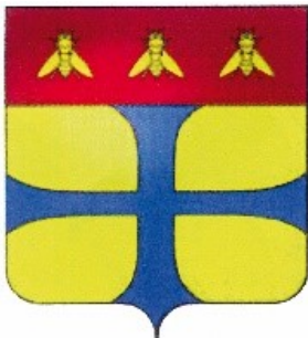
ORDINE DEGLI AVVOCATI DI PARMA

La partecipazione al singolo incontro darà diritto al riconoscimento di n. 2 crediti formativi . La partecipazione all'intero ciclo darà diritto al riconoscimento di n. 12 crediti formativi .